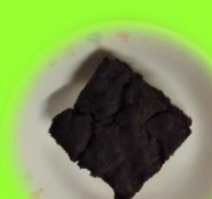
とうふブラウニー