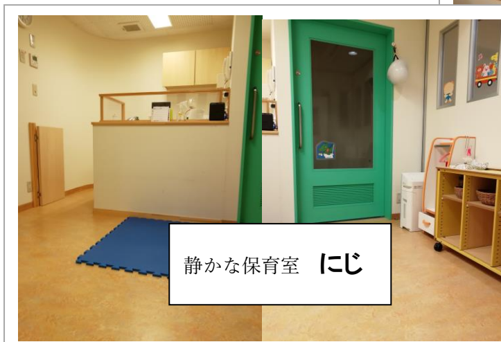
静かな保育室 にじ