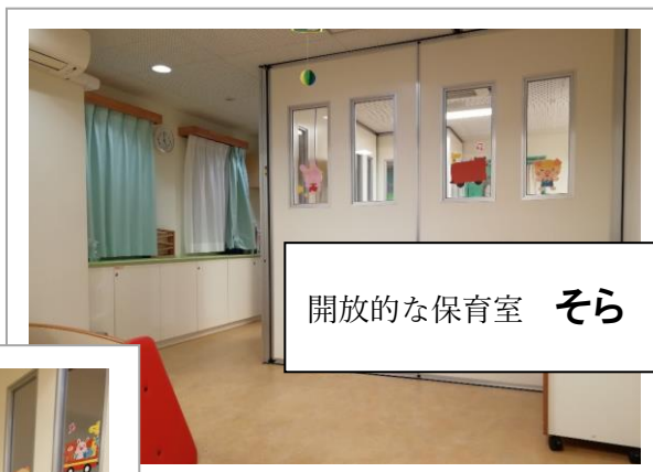
開放的な保育室 そら